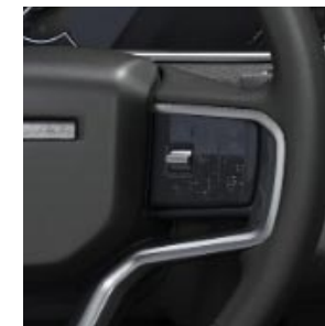
LEVE DI SELEZIONE MARCE AL VOLANTE