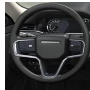
PIANTONE DELLO STERZO